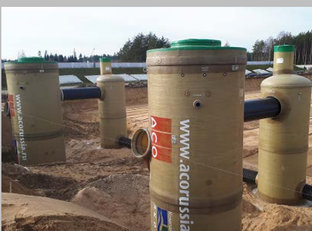
Индустриальный парк "Великий камень" "Оборудование для очистки поверхностного стока в составе ЛОС накопительного типа с самым большим в мире безбетонным аккумулярующим резервуаром АСО StormBrixx, Минск, Республика Беларусь